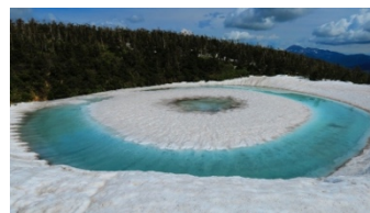
八幡平ドラゴンアイ