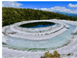
八幡平ドラゴンアイ