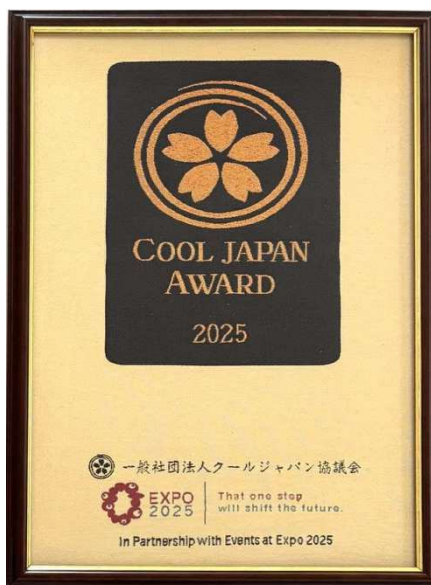
西陣織で作成した盾

【COOL JAPAN TV】 http://cooljapan.info/cooljapantv.html