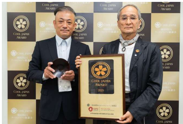
Vermicular オープンポット2・スープポット (愛知県/愛知ドビー株式会社)