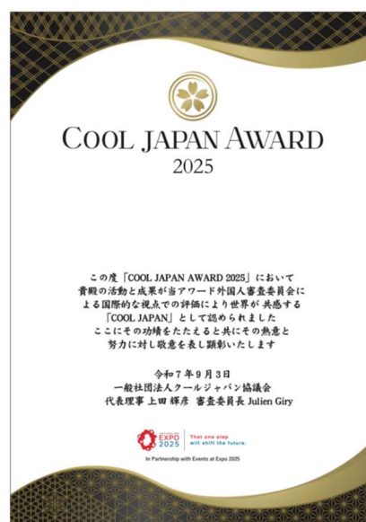
組子模様をほどこした表彰状