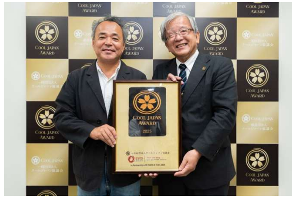
クルーズトレイン「ななつ星 in 九州」（福岡県／九州旅客鉄道株式会社）