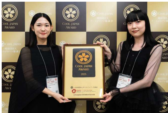
PM-Line Premier Maison (東京都/株式会社アステック)