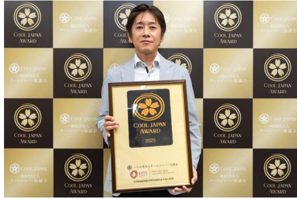
高山茶釜 (奈良県/生駒市・奈良県高山茶釜生産協同組合)